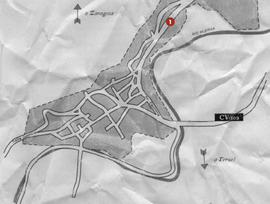
1 BODEGAS TOSOS ECOLÓGICA